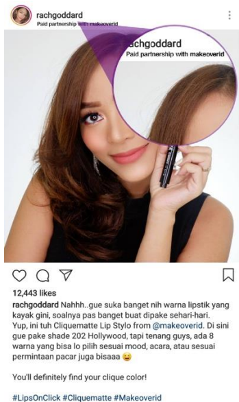
Gambar 3. Stimulus pos Instagram untuk kelompok dengan DL