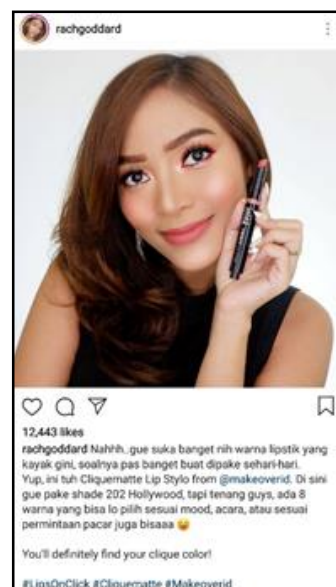
Gambar 2. Stimulus pos Instagram untuk kelompok tanpa DL

Gambar. Berikut ini adalah stimulus yang peneliti gunakan sebagai manipulasi.